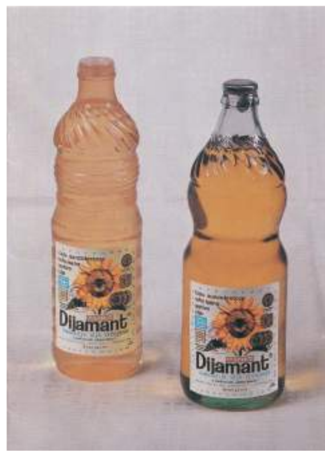
Стаклена флаша коришћена као амбалажа од 1969., а пластична од 1974. године