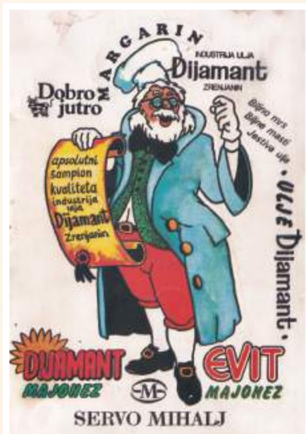
Рекламни материјал Индустије уља „Дијамант“ – Зрењанин (СМ), око 1983.

У периоду од 1982. до 1985. године завршен је нови монументални силос капацитета 22.000 тона сунцокрета или 40.000 тона житарица, који је потпуно променио визуру и силуету града. Ову својеврсну источну капију града извело је предузеће ГИК „Банат“. У оквиру силоса изградња је најсавременија сушара капацитета 900 тона на дан. Године 1987. почели су радови и на изградњи нових погона „Биме“ у кругу уљаре, који су завршени тек 1991. године. Укидањем Закона о удруженом раду 1990. године, фабрика уља фактички напушта ИПК „Серво Михаљ“ и врши пререгистрацију под називом Друштвено предузеће Индустија уља „Дијамант“. Том приликом регистровано је и обављање извозно-увозних и других послова, које су до тад обављале комбинатске службе.