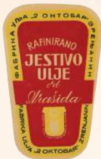
кат. бр. 6