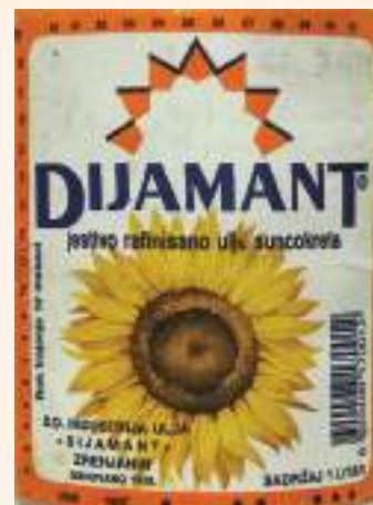
кат. бр. 44