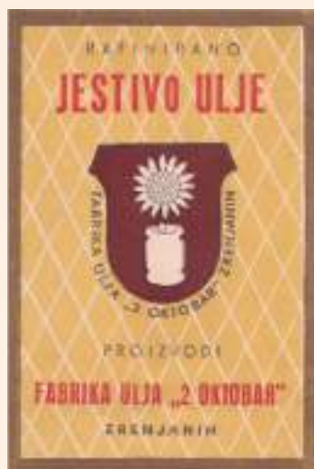
кат. бр. 5