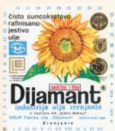
кат. бр. 18