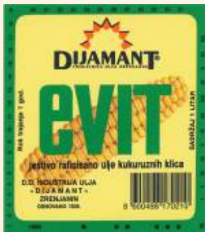
кат. бр. 43