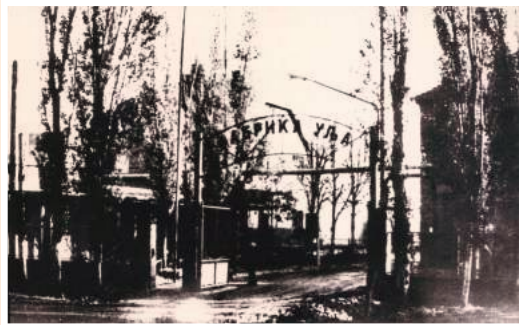
Некадашњи улаз у фабрички комплекс Фабрике уља

Непуних недељу дана након ослобођења Градски народноослободилачки одбор у Петровграду именује привремену управу (одбор) у фабрици, која је уз помоћ радника обновила производни циклус. Крајем новембра 1946. године решењем Владе Федеративне Народне Републике Југославије уљара је постала државно предузеће које мења назив у Фабрика уља „2. октобар“. Исте године, фабрика је произвела 3.645 тона јестивог и 650 тона техничког уља, радећи у надлежности Генералне дирекције прехранбене индустрије Југославије.