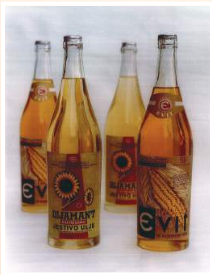
Флаше за уље коришћене као амбалажа у периоду 1963–1973.