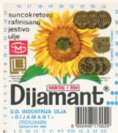
кат. бр. 41