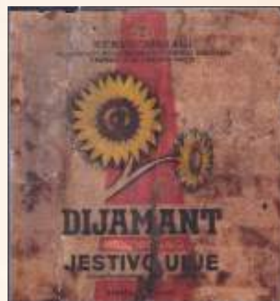
кат. бр. 14