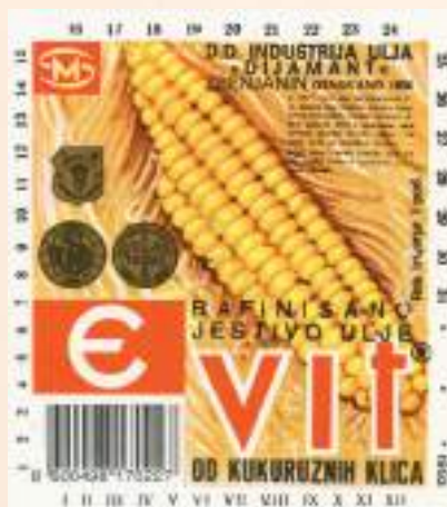
кат. бр. 42